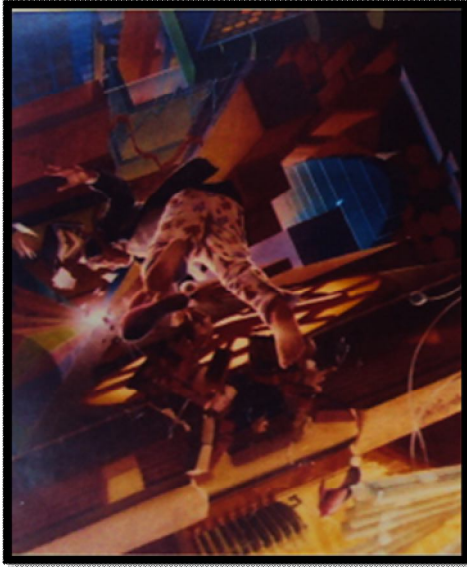
شكل (٣) (٧-٨٠) للفنان ماجارد ، أكريلك ، ألوان زيت ، ١٥ x ١٩ سم