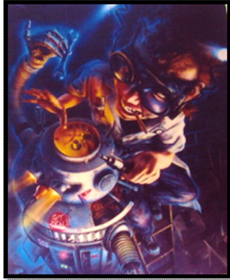
شكل (٢) (٧-٧٩) للفنان مارك.أ فريد ركسون ، ألوان أكريلك ، ١٨ x ٢٦ سم