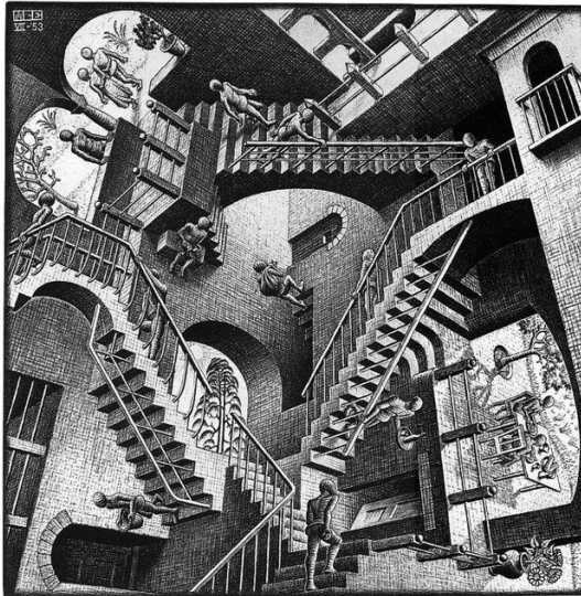
شكل (٦) صورة "النسبية" للفنان اشر"، ٣١٧سم x ٣١٩سم بمعارض الرسم ،

وفى " معرض الرسم " للفنان " أشر " شكل (٧) عبر في هذا التكوين عن مباني كما لو كانت لوحة داخل معرضا للرسم به مجموعة من الصور حيث أخذت هذه الصورة السيادة داخل العمل ، وبحيث هيمنت على التكوين ككل والتي عبرت عن الموضوع الأساسي الذي يريد الفنان التعبير عنه ، وقام الفنان برسم شخص يسار التكوين يشاهد هذه الصورة كما لو كانت تقع أسفل نظره .