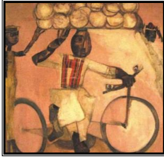
شكل (٥) (١-٩) الفنانة تحية حليم

في مستوى النظر ظهر من خلاله باقى عناصر العمل الفنى ، ويتضح بالعمل تعدد اتجاهات الرؤية فيوجد منظور في مستوى الرؤية ومنظور تحت مستوى النظر .